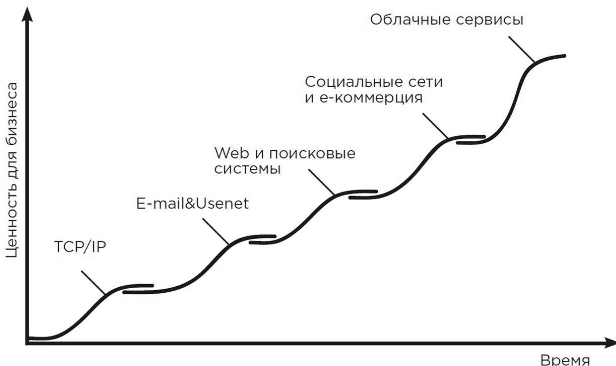
Рис. 2. Этапы в развитии ИКТ. Fig. 2. Stages in ICT development.

здать еще более разумные и сделать это быстрее, чем первоначальные их конструкторы – люди. Эта положительная обратная связь скорее всего окажется столь сильной, что в течение очень короткого промежутка времени (месяцы, дни или даже всего лишь часы) мир преобразится больше, чем мы можем это представить, и внезапно окажется населен сверхразумными созданиями.