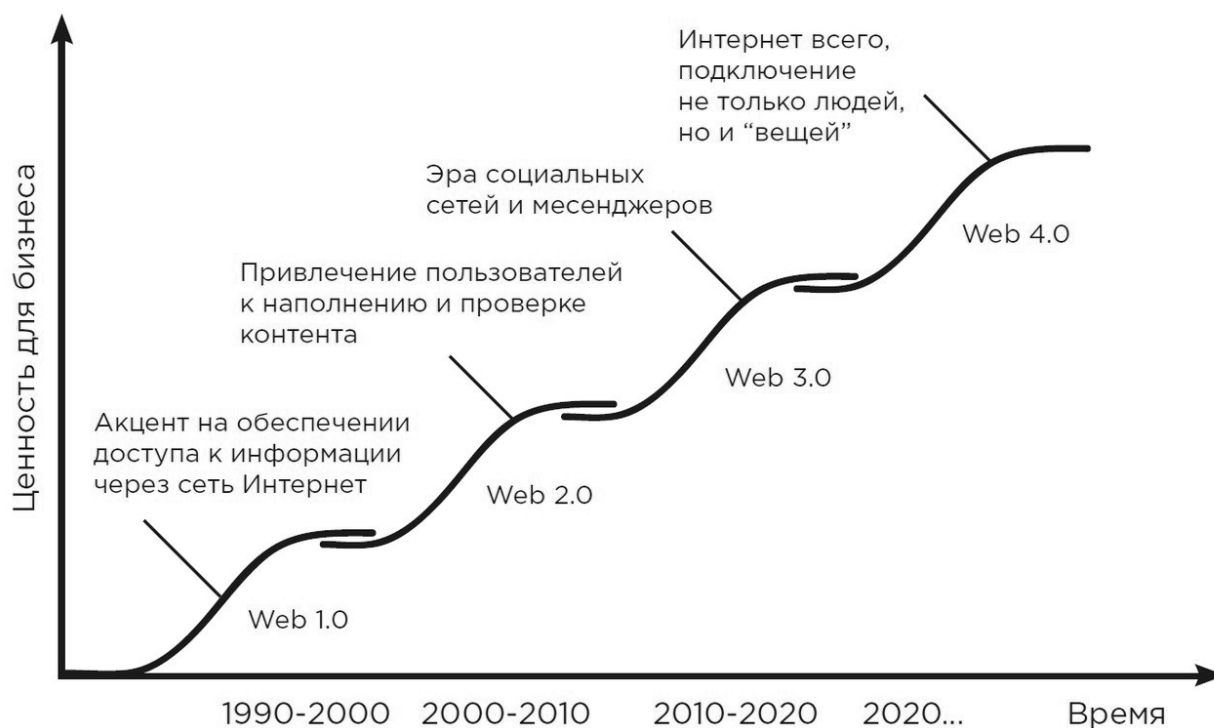
Рис. 3. Этапы в развитии web-технологий. Stages in the web-technologies development.

нологии формируют новые формы антиутопии. И общество пока не понимает, как адаптироваться к меняющейся реальности.